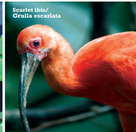
Scarlet ibis/ Grulla escarlata

Nature lovers will enjoy the flora of Trinidad's Botanical Gardens, the broad variety of animals at the Emperor Valley Zoo, and the myriad indigenous species (including the scarlet ibis) at the Caroni Bird Sanctuary. The annual Tobago Heritage Festival (mid-July to early August) pays tribute to the island's African ancestry, traveling from village to village in a celebration of culture.